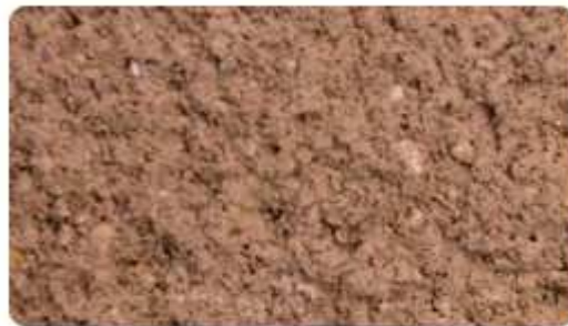
240 - Marron moyen