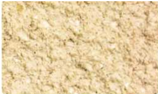
212 - Terre beige