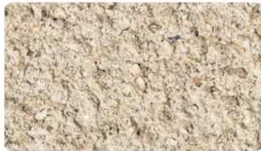
545 - Terre d'arène