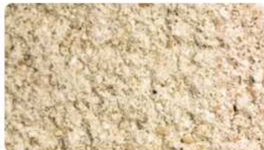
207 - Beige clair