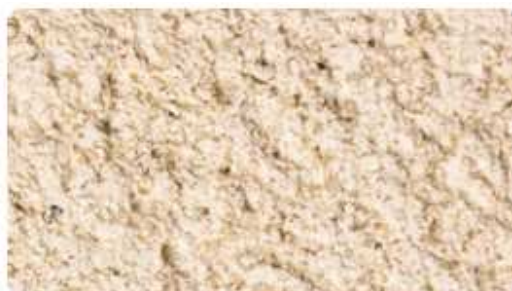
009 - Beige