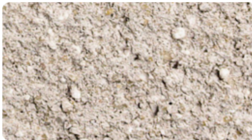
202 - Cendre beige foncé