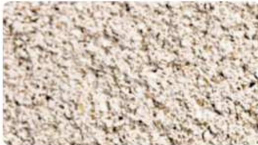
203 - Cendre beige clair

Les enduits devront être choisis dans la gamme des nuances des matériaux présentes ci-dessous : (WEBER ou équivalent)