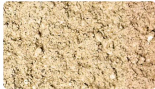
215 - Ocre rompu